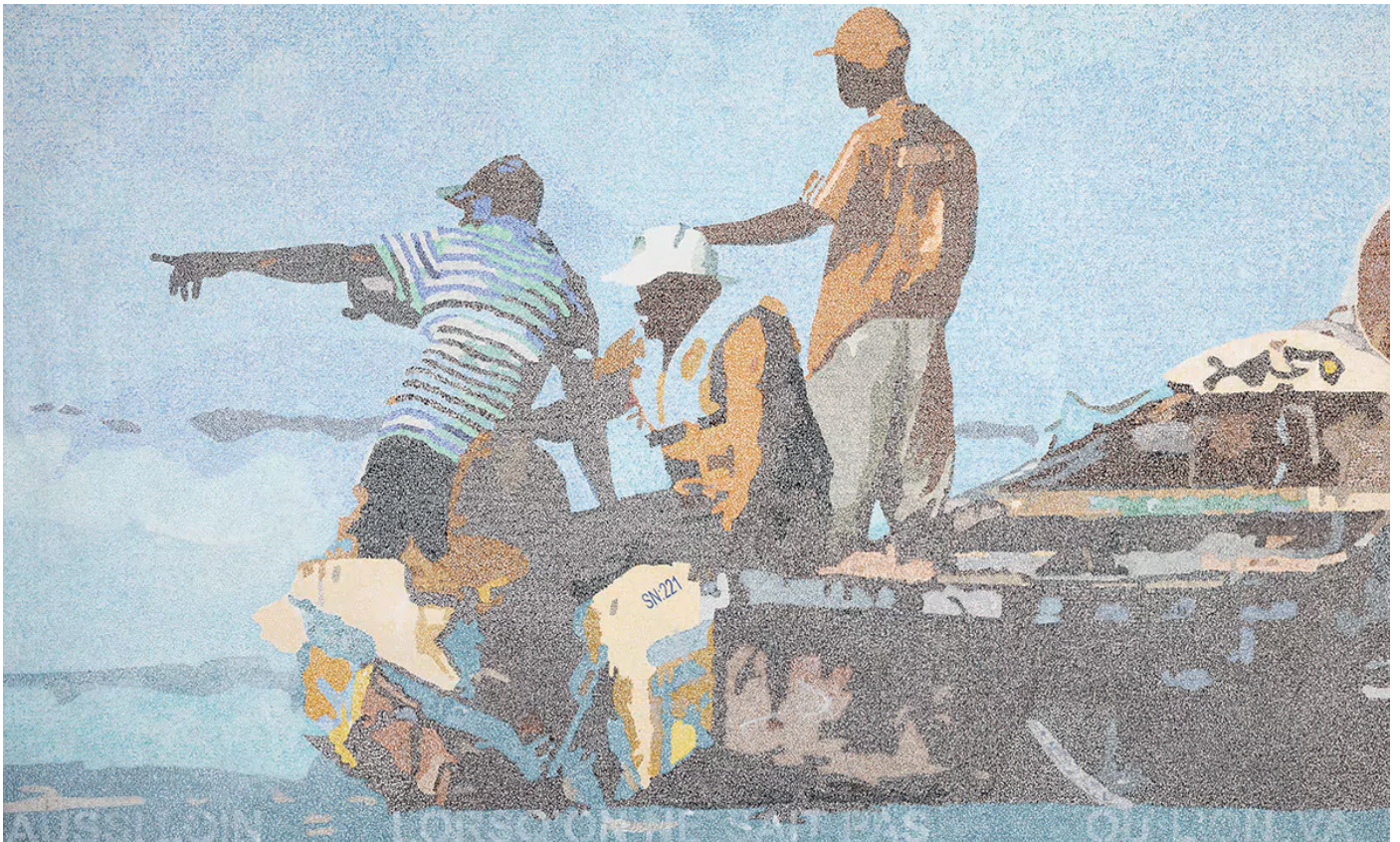
L'Attente de sauvetage, 2023 ©Alioune Diagne, galerie Templon